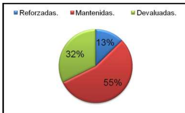
Figura 2. Distribución de las féminas según vínculo afectivo mantenido con el agresor postagresión.

Las lesiones no graves que requirieron tratamiento médico (44,48%) y las secuelas anatómicas (84,78%) fueron los resultados más sobresalientes en las consultas de medicina legal. Los celos (51,29 %) y la infidelidad (39,49 %) fueron los motivos más referidos en los actos violentos declarados (Figura 3). Los motivos de las agresiones tienen múltiples orígenes y está íntimamente ligado a una diversidad de factores muchas veces imposible de enumerar. Las condiciones psíquicas del agresor, las condiciones económicas, la influencia del ambiente y otros tantos pueden ser un ejemplo claro de la multifactorialidad en el origen de la violencia hacia el género femenino. En nuestra serie predominaron los motivos con un basamento sexuado. La infidelidad comprobada o sospechada y los celos se argumentaron en 511 agresiones como causa de las mismas y esto se correspondió con el 77,3% del total de agresiones denunciadas. Lo antes expuesto no pone ante una sociedad agresiva donde los elementos que denotan sexualidad cobran una importancia capital.